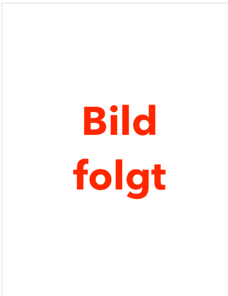
Hersteller-Bild: MUNK Günzburger Steigtechnik