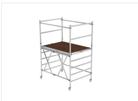
Hersteller-Bild: MUNK Günzburger Steigtechnik