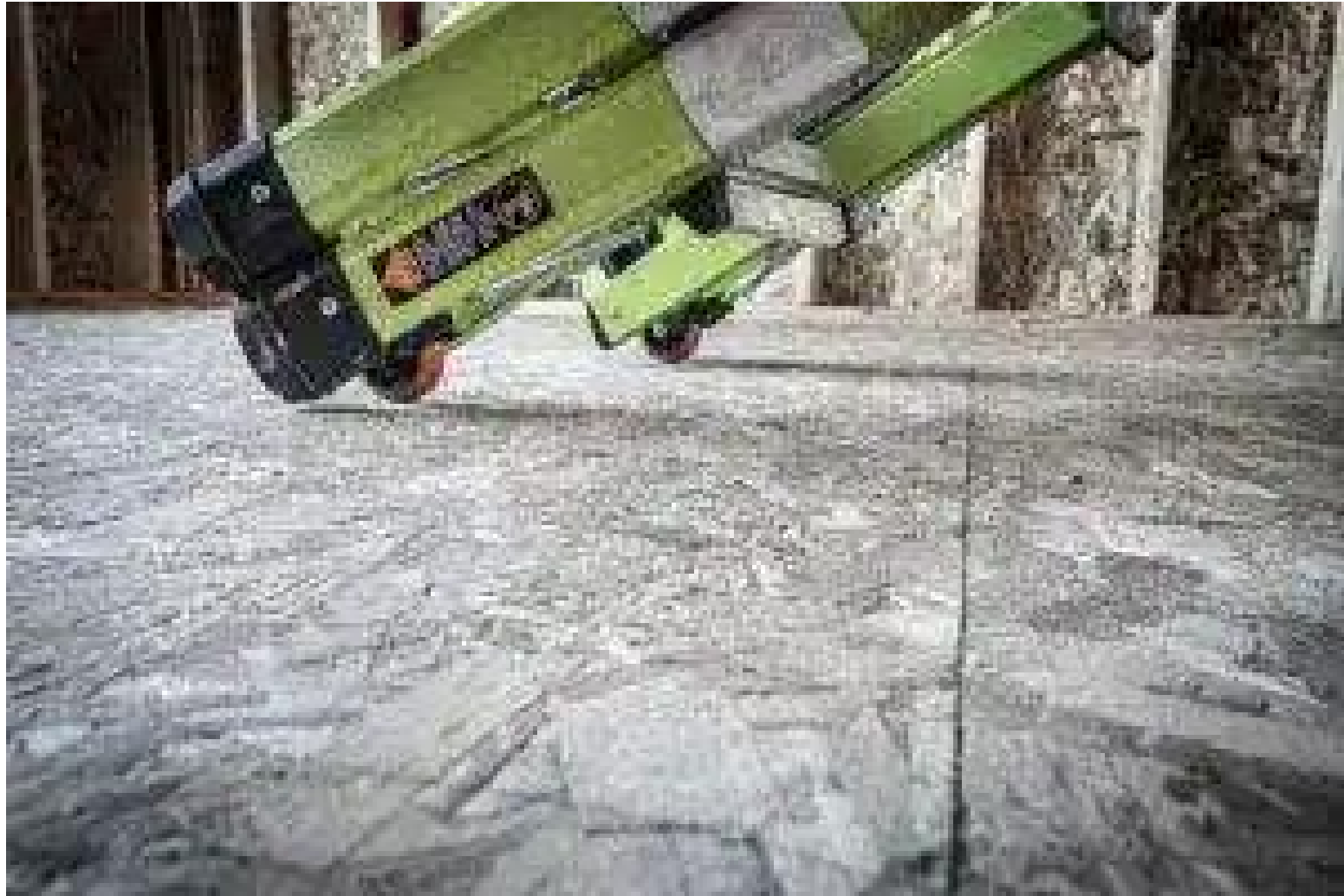
TIP UND GLIDE ROLLEN Für den einfachen und rüchenschonenden Transport.