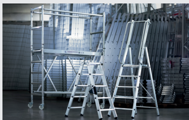
MUNK Günstzburger Steigtechnik

MUNK Günstzburger Steigtechnik ist eine Marke der MUNK Group und steht für Leitern, Rollgerüste und Sonderkonstruktionen in Premium-Qualität.